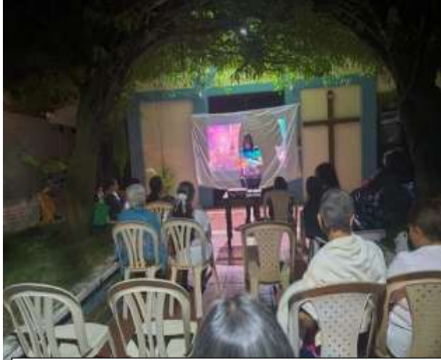
HORA: 7:32 p.m. FECHA: 30 de Agosto del 2025 LUGAR: Tierra Blanca