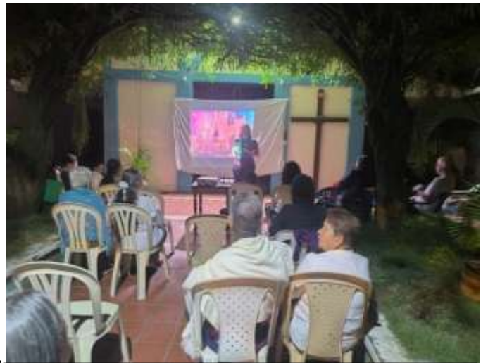
HORA: 9:50 p.m. FECHA: 30 de Agosto de 2025 LUGAR: Tierra Blanca